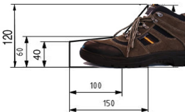
volgens P159 (t/m 1997)

Wanneer een hefbrug voldoet aan de eisen uit P159 (onderste tekening) worden de volgende aanvullende maatregelen geadviseerd.